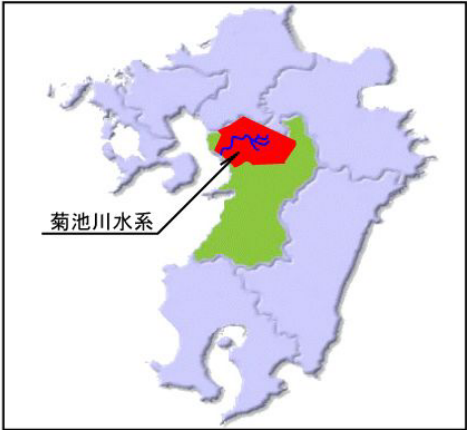
菊池川水系位置図