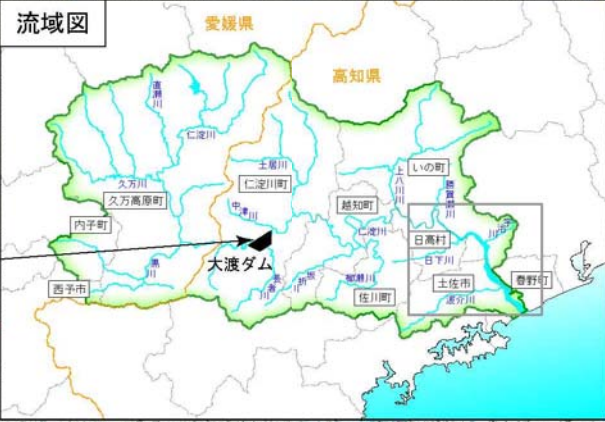
大渡ダム 昭和61年竣工 (仁淀川町)