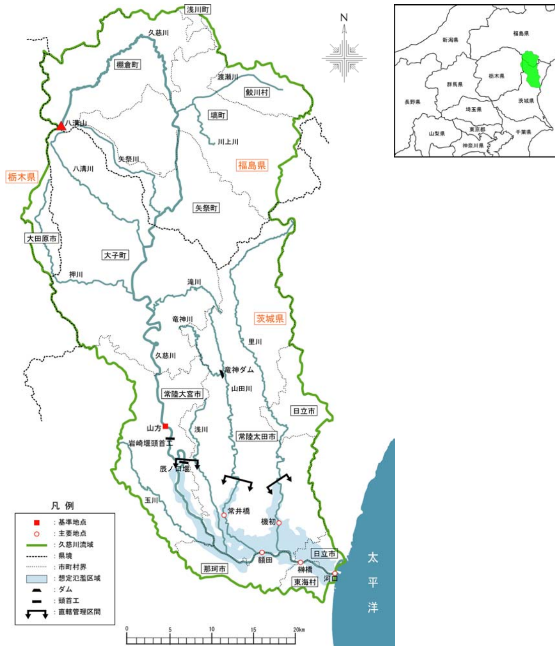
(参考図) 久慈川水系流域図