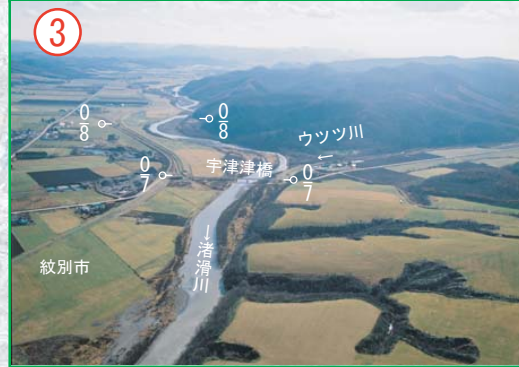
宇津津橋付近 (KP7.0付近)