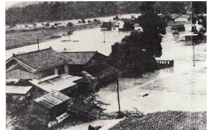
愛本付近の浸水状況