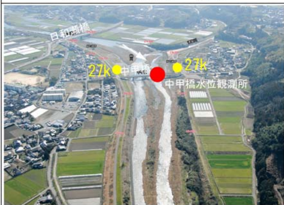
⑤ 緑川中甲橋付近 (27k付近)