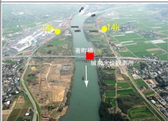
④ 緑川基準地点城南 (御船川合流点) 付近 (14k付近)