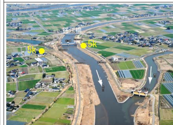
⑦ 浜戸川碓江地点 (5k付近)