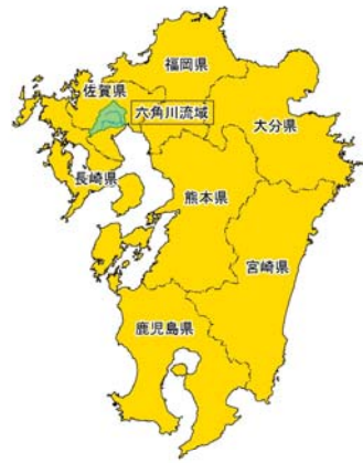
六角川流域位置図