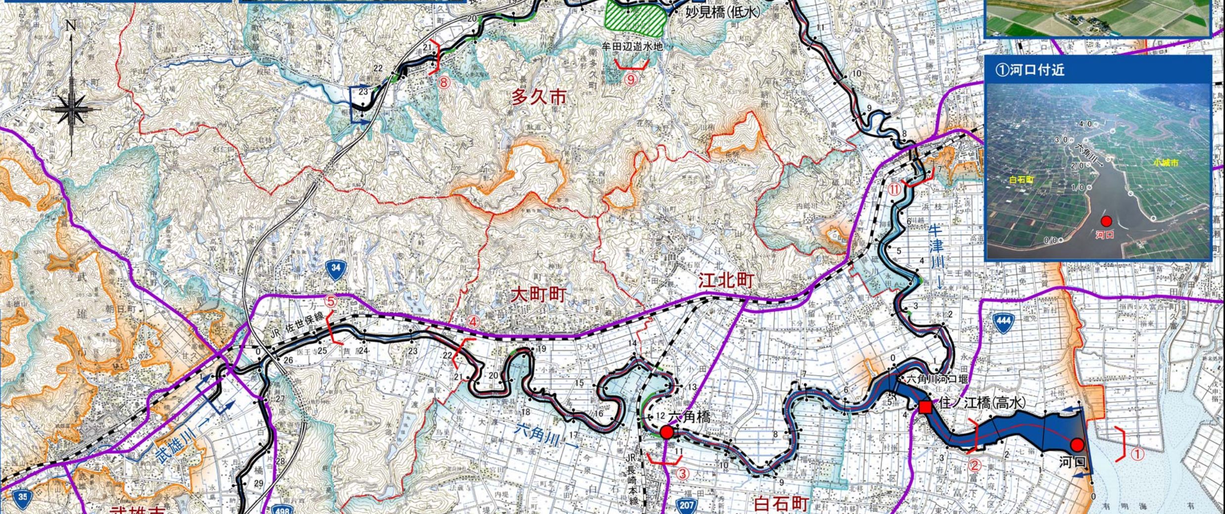
⑤新橋地点 [24.1 k 付近]