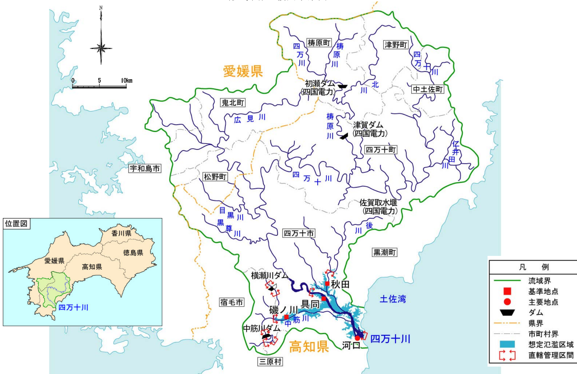
(参考図) 渡川水系図