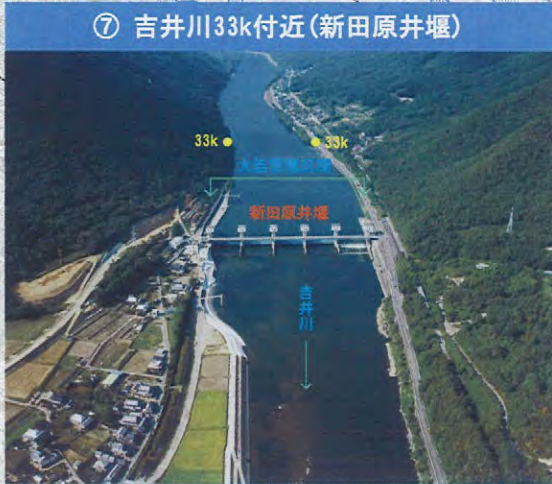
⑦ 吉井川33k付近(新田原井堰)