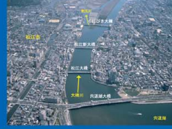
⑤ 大橋川 松江大橋付近