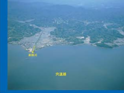
⑥ 突道湖 来待川流入点