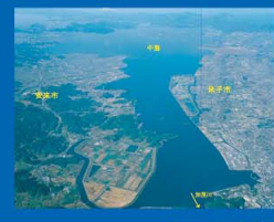
③ 中海 米子湾