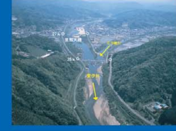
⑩斐伊川 三刀屋川合流点