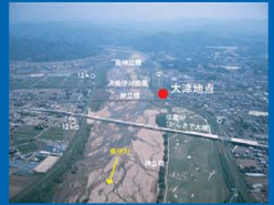
⑧斐伊川 神立橋付近