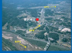
⑭斐伊川放水路 斐伊川からの分流点