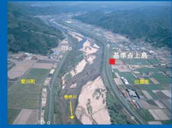
⑨斐伊川 基準点上島地点