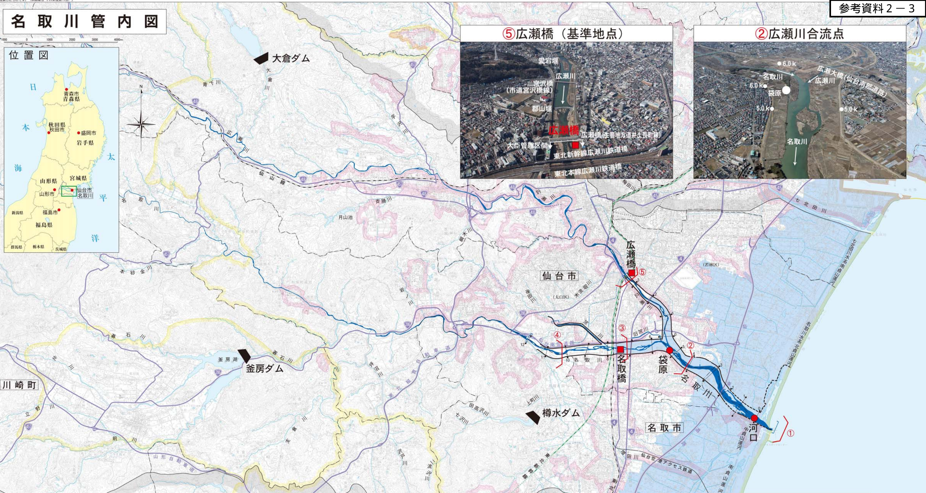
⑤ 広瀬橋 (基準地点)