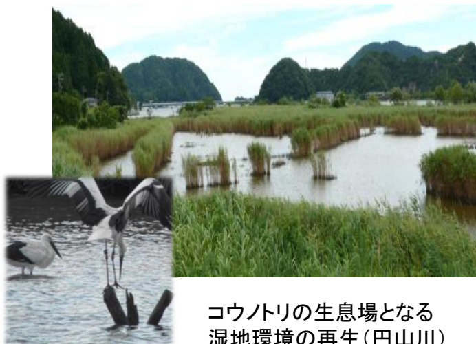
コウノトリの生息場となる 湿地環境の再生(円山川)