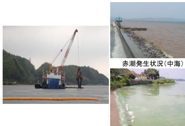
覆砂等による水質の浄化(中海、宍道湖)