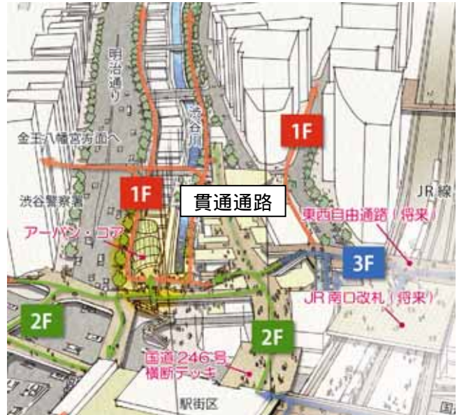
歩行者ネットワークイメージ(渋谷駅街区上空より望む)

貫通通路の緩やかな線形に沿って店舗が連なり、渋谷川の緑と水の潤いも感じることができ賑わい空間を創出します。