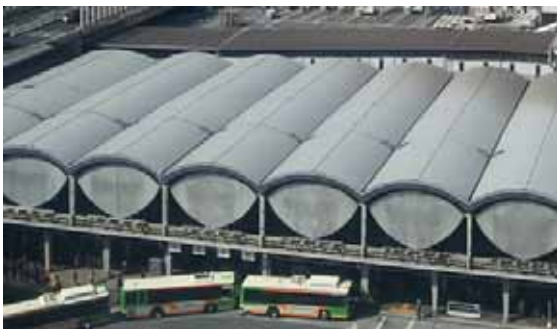
旧東横線渋谷駅舎

また、渋谷駅街区から渋谷駅南街区へ国道246号を横断する歩行者専用デッキは、旧東横線高架橋を再利用して整備し、かまぼこ屋根や目玉型壁面のデザインなど、東横線の記憶をデザインとして一部に採り入れていきます。