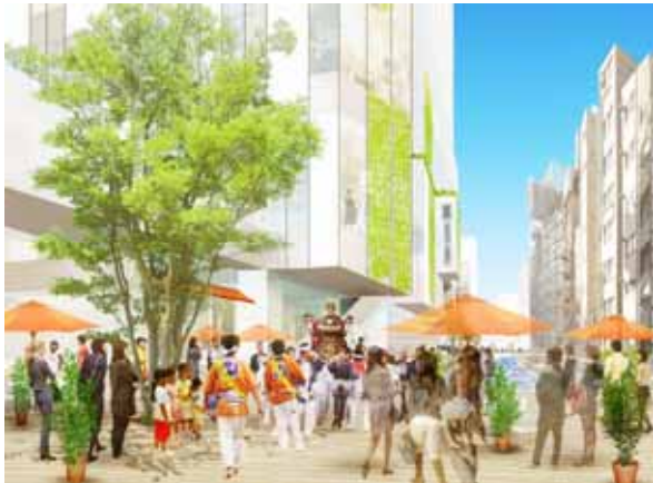
渋谷三丁目のシンボルとなる広場イメージ

渋谷川広場はにぎわいの広場として、稲荷橋下流側に「渋谷三丁目のゲートとなる広場」、金王橋上流側に「渋谷三丁目のシンボルとなる広場」の計2箇所の広場を整備します。これらの広場の間には清流復活水を活用した「壁泉」とよばれる水景施設を整備し、視覚的にも聴覚的にも賑わいと潤いのある良好な水辺空間を整備いたします。また、約600mにわたって緑の遊歩道を整備し、ツタなどによる護岸緑化、高木の並木により緑と水のネットワークを形成します。