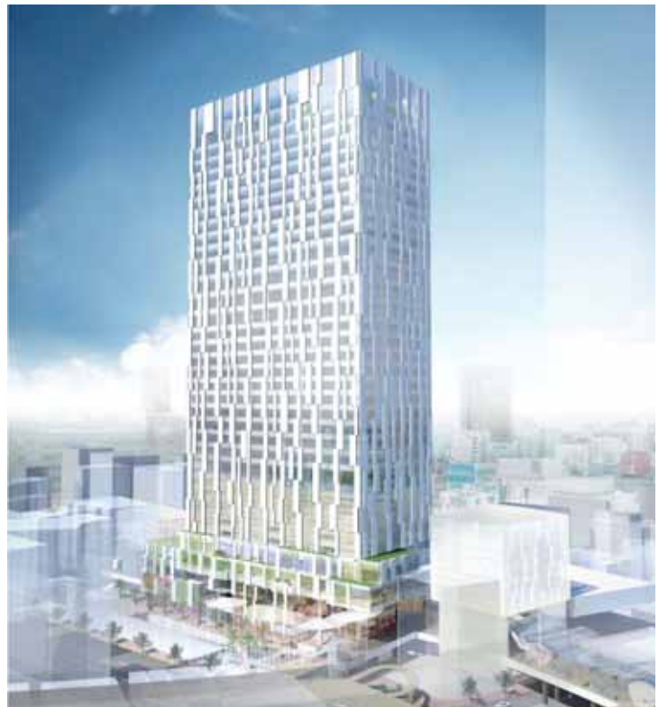
全体イメージ（渋谷ヒカリエ方面より望む）