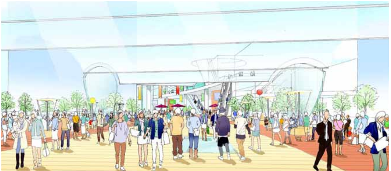
国道246号横断歩行者専用デッキのイメージ