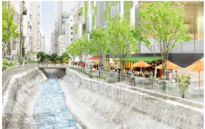
壁泉と渋谷川沿い店舗の賑わいイメージ