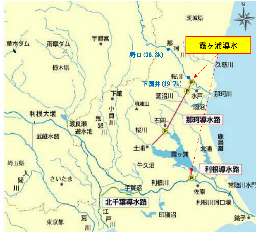
図 1-1 霞ヶ浦導水位置図.