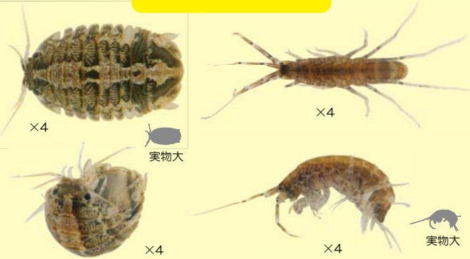
イソコツブムシ類