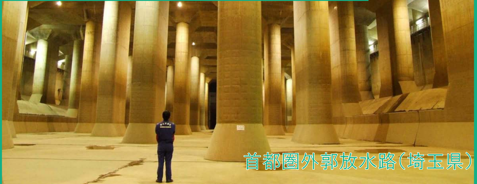
首都圏外郭放水路(埼玉県)