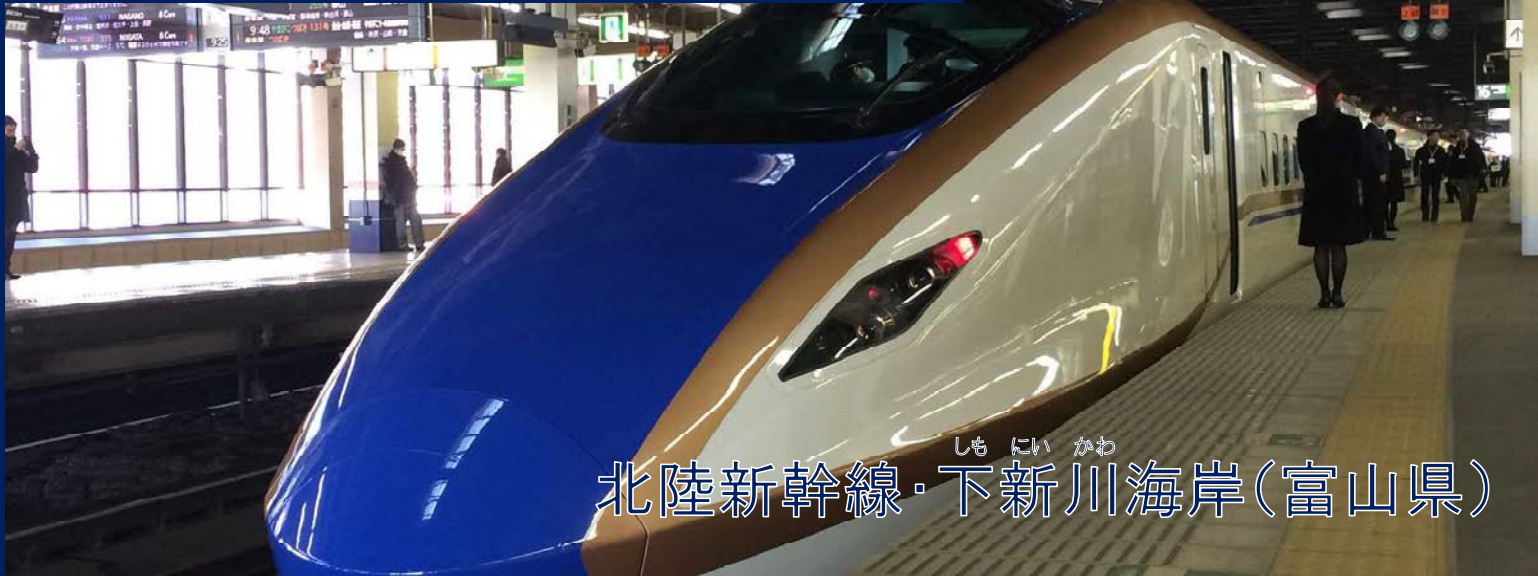
北陸新幹線・ しもにいかわ 下新川海岸(富山県)