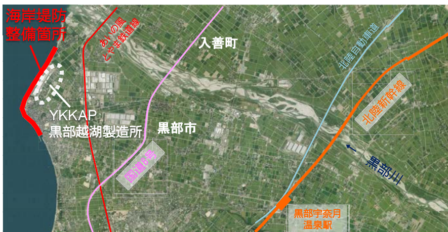
黒部越湖製造所(建材部門の基幹工場)