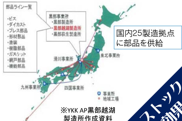
国内25製造拠点 に部品を供給