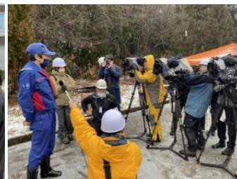
取材対応状況(国道359号)