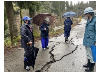
緊急調査状況 (一般県道仏生寺太田線)