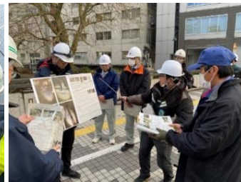
緊急調査状況(市道県庁線 塩倉橋)