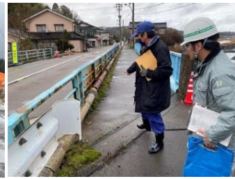
緊急調査状況 (主)水見惣領志雄線 島崎橋)