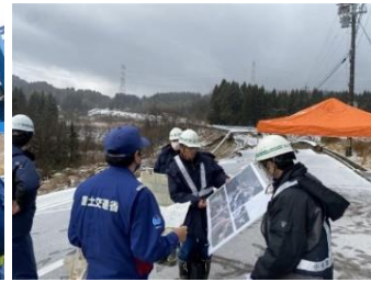
緊急調査状況(国道359号)