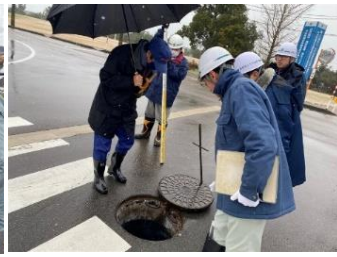
緊急調査状況(高岡市公共下水道)