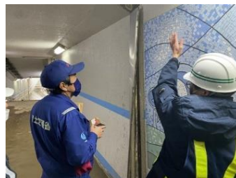
緊急調査状況(国道471号)