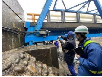
緊急調査状況 (国道415号 新庄川橋)