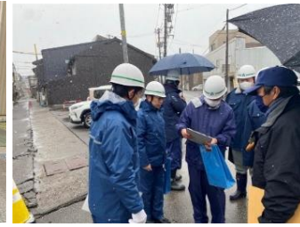
緊急調査状況 (市道伏木古国府伏木中央線)