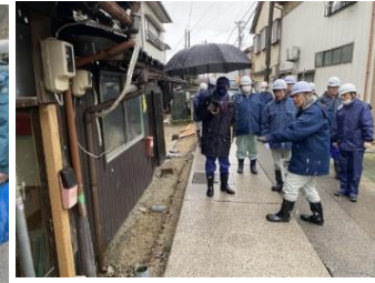
緊急調査状況 (高岡市公共下水道)