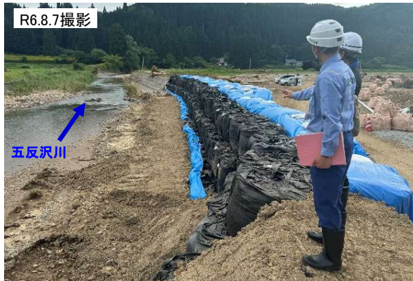
緊急調査状況(五反沢川 右岸)