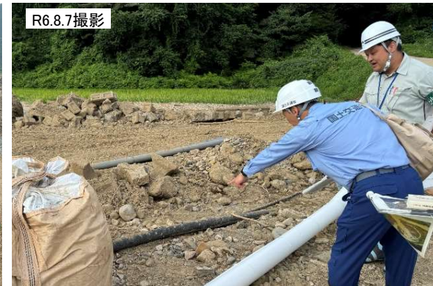
緊急調査状況(五反沢地区簡易水道)