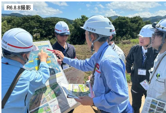
緊急調査状況(石沢川 左岸)