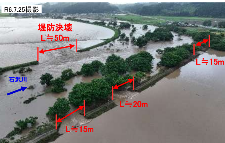
一級河川子吉川水系 石沢川(由利本荘市) 被災状況