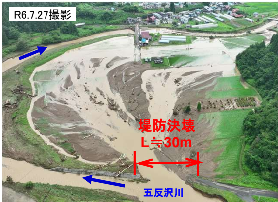
一級河川米代川水系 五反沢川(上小阿仁村) 被災状況