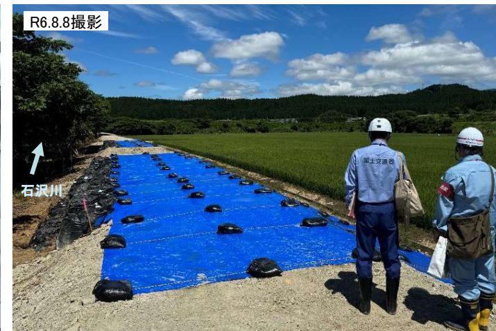
緊急調査状況(石沢川 右岸)