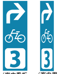
(案内看板シール) (案内用路面表示)