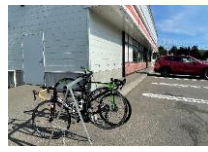
セイコーマートとの連携(休憩施設、サイクルラック設置)