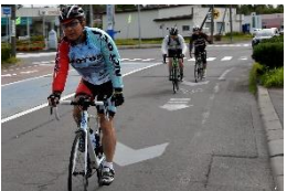
(矢羽根型路面表示設置箇所)

・車道における自転車通行位置を自転車利用者とドライバーの双方に示し「安全」な走行環境を確保するため、ルート上の主要な交差点部、急カーブの手前、トンネルの入口手前等に設置。