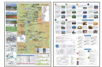
サイクリングマップ作成