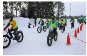
冬季サイクリングイベントの実施