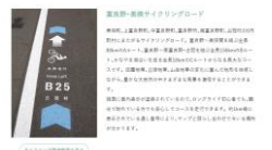
サイクリストアンケートの実施