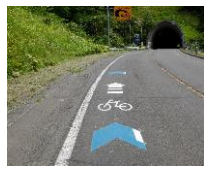
(矢羽根型路面表示設置箇所)

・車道における自転車通行位置を自転車利用者とドライバーの双方に示し「安全」な走行環境を確保するため、ルート上の主要な交差点部、急カーブの手前、トンネルの入口手前等に設置