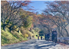
立石公園サイクルツアー (スワヤツサイクル※2)