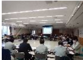
「諏訪湖周自転車活用推進協議会」 行政や事業者等による安全対策や観光推進