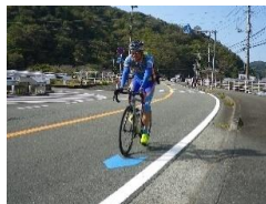
(矢羽根型路面表示設置箇所の走行状況)