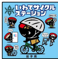
いわてCSステッカー