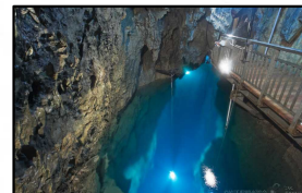
龍泉洞 (岩泉町)