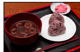
はっちよだんごと雑穀おにぎり (二戸市)