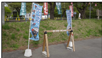
いわてCS(のぼり旗とサイクルラック)