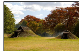
御所野遺跡 (一戸町)