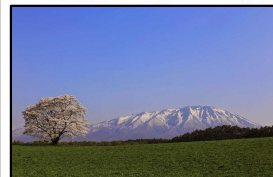
小岩井農場 (滝沢市・雫石町)