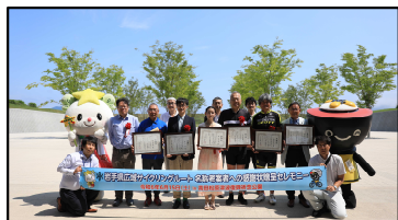
ルート名称考案者への 感謝状贈呈セレモニー