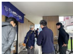
(ゲートウェイ視察)