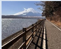
(自転車歩行者専用道)