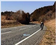
(矢羽根型路面表示)