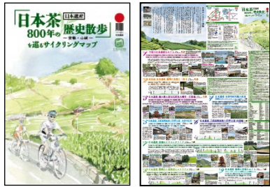
「日本茶800年の歴史散歩」を巡るサイクリングマップ