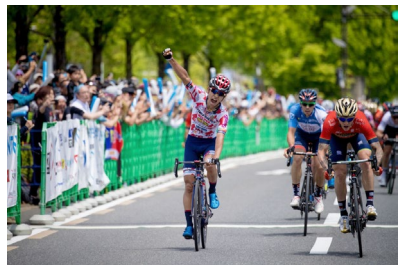
ツアー・オブ・ジャパン京都ステージ