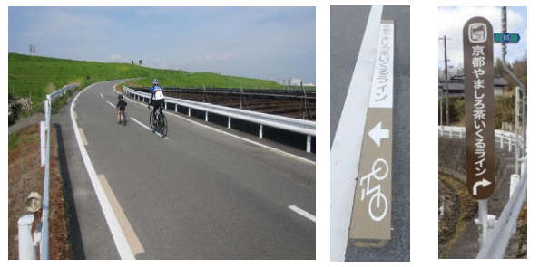
(誘導ライン) (路面表示) (誘導サイン)