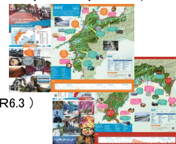
四国一周1,000kmルートマップ