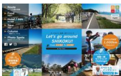
四国一周サイクリングポータルサイト