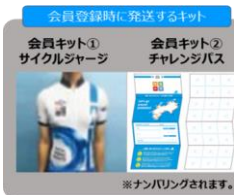
会員登録時に送付するキット