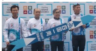
ピクト整備セレモニー