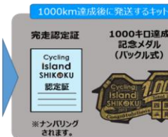
1000km達成後に送付するキット