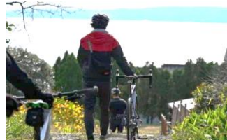
(レンタサイクル付ガイドツアー有)