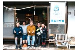
(サイクルオアシス)

取組先進地を参考に、沿線の道の駅や飲食店、宿泊施設などに、修理キットやサイクルスタンド等を設置。 地域の事業者が、トイレやドリンクの補給、休憩などができるスペースとして協力。