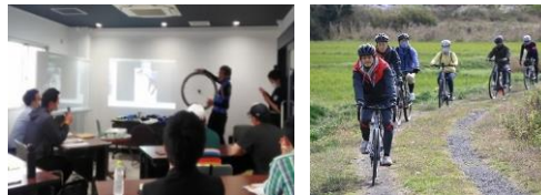
(サイクルガイド育成研修) (モニターツアーの開催)