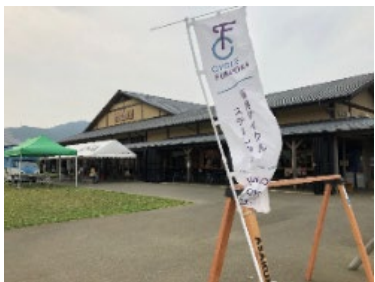
(福岡サイクルステーション)