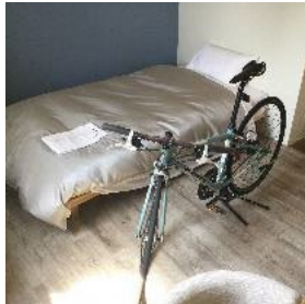
（サイクリストに優しい宿）