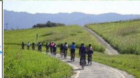
【筑後川サイクリングロード】