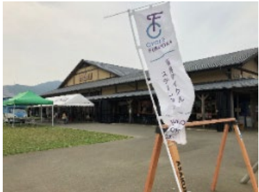
（福岡サイクルステーション）