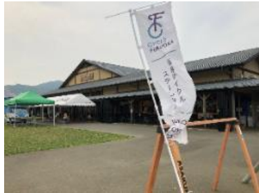
(福岡サイクルステーション)