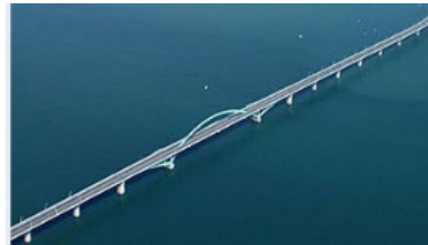
【北九州空港連絡橋】