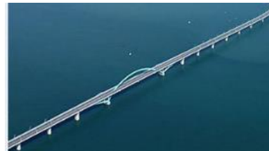
【北九州空港連絡橋】