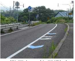
（交差点部案内看板）