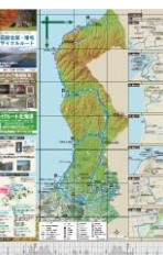
サイクリングマップの制作・配布