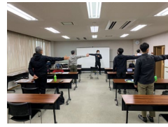
サイクリングガイドセミナーの実施