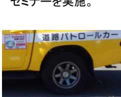
サイクリスト応援カー