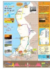
サイクリングマップの制作・配布