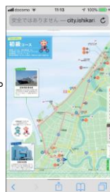
PR動画の作成・配信 HP(スマホ対応)