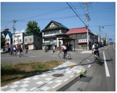
モニターツアーの実施