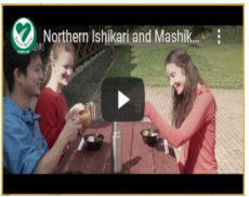
PR動画の作成・配信