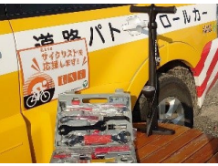
サイクリスト応援カーの取組を実施