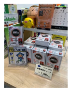
（タイヤ交換用スペアチューブ）