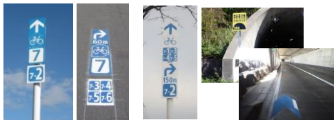
(案内看板・路面表示 地域ルート モデルルート+地域ルート) の案内 注意喚起看板・矢羽根型路面表示