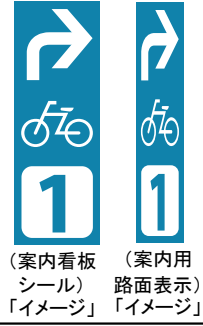
(案内看板シール) (案内用路面表示) 「イメージ」 「イメージ」