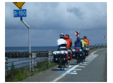
(矢羽根型路面表示設置箇所の走行状況)「イメージ」

・車道における自転車通行位置を自転車利用者とドライバーの双方に示し「安全」な走行環境を確保するため、ルート上の主要な交差点部、急カーブの手前、トンネルの入口手前等に設置