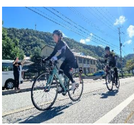
（コウノトリチャレンジライド）