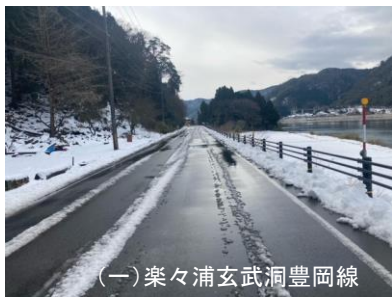
（一）楽々浦玄武洞豊岡線 （車道拡幅）