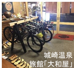
城崎温泉 旅館「大和屋」 （サイクリスト向け宿泊施設）