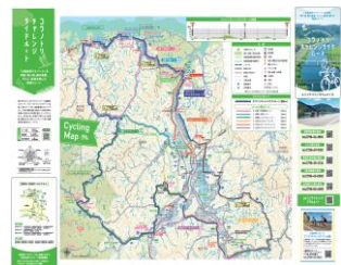
（ルートマップの作成）