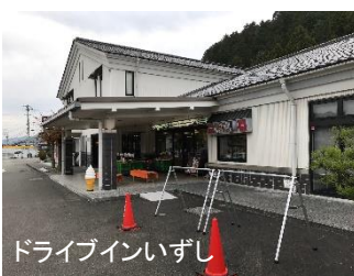
ドライブインいずし （サイクルラック設置）