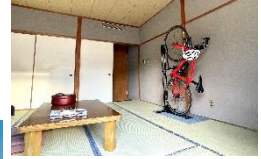
▲鳥取県サイクリストに優しい宿