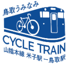
◀サイクルトレイン