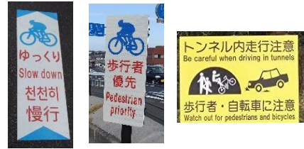
▲注意喚起路面表示・看板