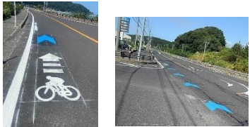
▲矢羽根・自転車ピクトグラム

○矢羽根等の路面表示及び注意喚起看板の設置 ルート上に矢羽根・自転車ピクトグラム等の路面表示及びサイクリスト・ドライバー向けの注意喚起看板を設置。