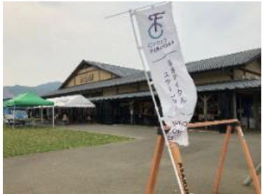
(福岡サイクルステーション)