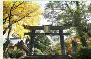
【英彦山神宮 銅の鳥居】