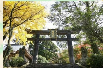
【英彦山神宮 銅の鳥居】