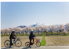
レンタサイクル 使用状況