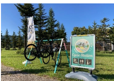
サイクルステーション 設置状況