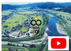
情報発信 動画配信