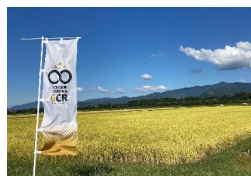
（ロゴマークの使用例）