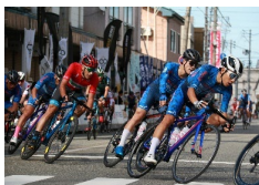
サイクルイベントの 様子