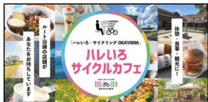
(ハレいろサイクルカフェ)