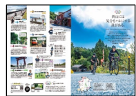
(専門誌: Cycle Sports)