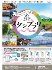
(スタンプラリーチラシ)