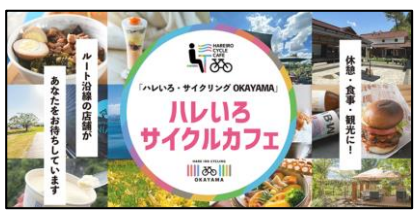
(ハレいろサイクルカフェ)