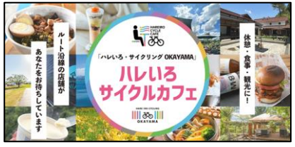
(ハレいろサイクルカフェ)