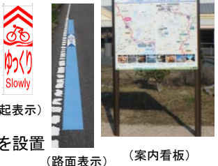
(注意喚起表示) (路面表示) (案内看板)