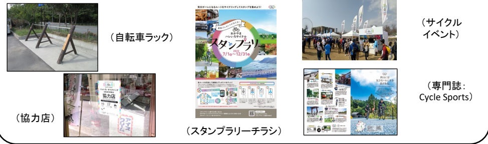
(自転車ラック) (協力店) (スタンプラリー出展) (サイクルイベント) (専門誌: Cycle Sports)