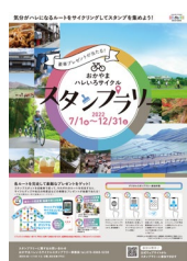
(スタンプラリーチラシ)