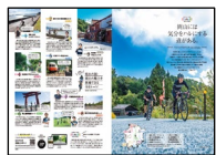
(専門誌: Cycle Sports)