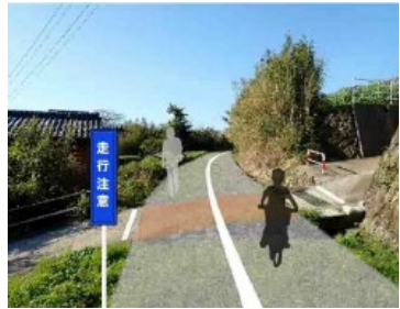
自転車道整備 (南島原市) 鉄道廃線敷きを活用 (イメージ)

○受入環境の整備(休憩所、メンテナンス・サポート体制等) ・サイクルスタンドやメンテナンススペースの設置が可能な既存休憩施設の活用手法を検討 ・地域のサイクルショップのサポート体制の構築を検討 ○魅力づくり(滞在コンテンツの充実・強化等) ・宿泊施設、温泉施設、商業・物産販売施設等において喜ばれるサービス等の調査 ・ビューポイントの選定 ○情報発信(ルートマップ、ICTの活用等) ・ルートマップ等の作成とICTを活用した情報発信方法の検討