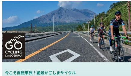
今こそ自転車旅! 絶景かごしまサイクル