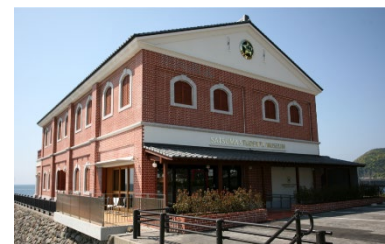
(薩摩藩英国留学生記念館)