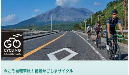
今こそ自転車旅！絶景かごしまサイクル