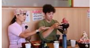
自転車系You Tuberによる情報発信