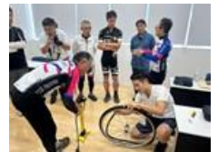
サイクルガイド養成

○情報発信 ・アンバサダーによる情報発信 ・PRポスター制作 ・のぼり旗制作によるPR ・HPによる情報発信、多言語 ルートマップ作成（令和7年2月末）