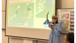
台湾向けイベント開催