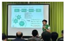
多言語ガイド養成