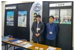
サイクルブース出展