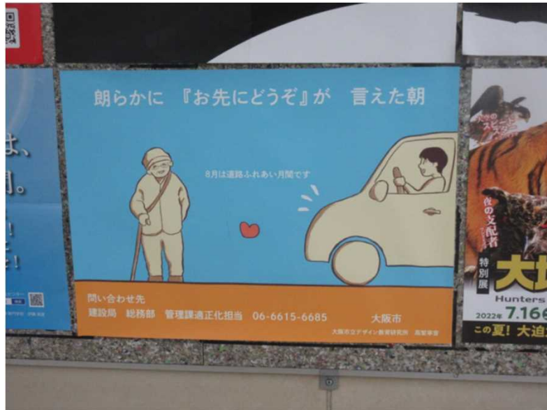
<地下鉄駅共用掲示板より>