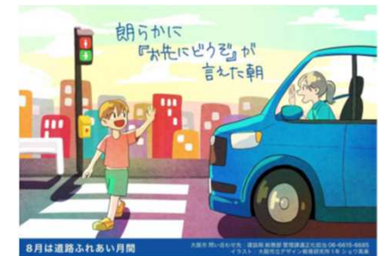
<大阪市ホームページより>