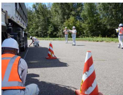
おひろ 帯広広尾自動車道 十勝管理ステーション