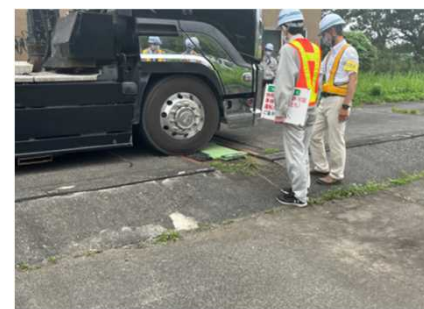
一般国道36号 のびのび 登別市富浦車両計測所