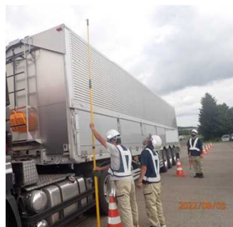
一般国道40号 わかぬい 椎内市駐車場

道路構造物の劣化を加速させる主要因となる特殊車両・過積載車両の通行に対する指導・取締りを通じて、道路利用者に道路利用の法令遵守の意識向上を促し、道路構造の保全や道路交通の危険防止につながる取組を行いました。