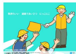
令和5年度「道路ふれあい月間」ポスター 制作：大阪市立デザイン教育研究所 高繁 寧音