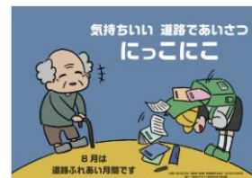
令和5年度「道路ふれあい月間」ポスター 制作：大阪市立デザイン教育研究所 笹田 真愛