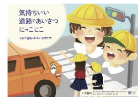
令和5年度「道路ふれあい月間」ポスター 制作：大阪市立デザイン教育研究所 富久 菜月