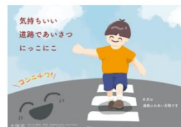
令和5年度「道路ふれあい月間」ポスター 制作：大阪市立デザイン教育研究所 那須野 詩織