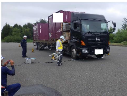
わつかない さらき とま ない 国道40号稚内市 更喜苫内駐車場

違法に走行している特殊車両・過積載車両は道路を劣化させる原因となるとともに、深刻な事故の原因となるため、指導・取締りを通じて道路利用者に法令遵守の意識向上を促し、道路構造の保全や道路交通の危険防止につながる取組を行いました。