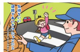
令和5年度「道路ふれあい月間」ポスター 制作：大阪市立デザイン教育研究所 讃岐 ひかり