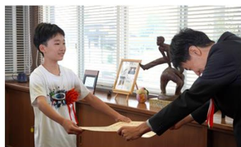
御殿場市立玉穂小学校にて