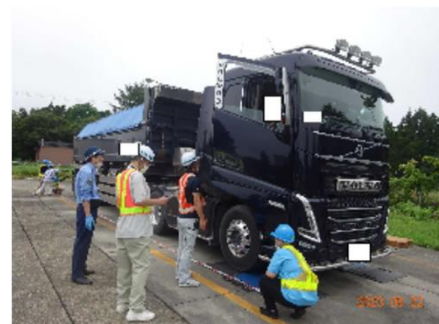
わしのき 国道5号 鷺ノ木車両計測所