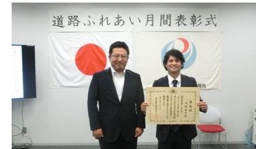
関東地方整備局 東京国道事務所にて