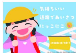
令和5年度「道路ふれあい月間」ポスター 制作：大阪市立デザイン教育研究所 川西 蘭音