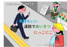
令和5年度「道路ふれあい月間」ポスター 制作：大阪市立デザイン教育研究所 藤田 桃香