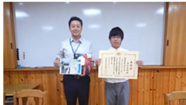
京都市立洛北中学校にて