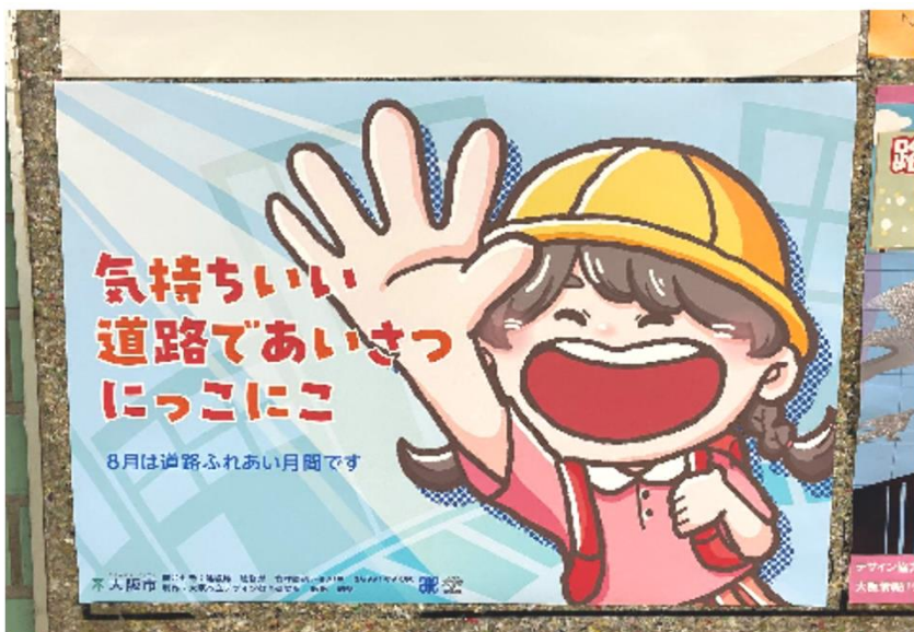
<地下鉄駅共用掲示板より>