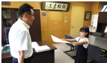
昭和町立押原小学校にて