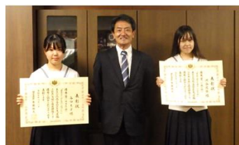
神戸学院大学付属中学校・高等学校にて