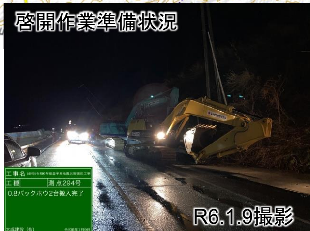
啓開作業準備状況

工事名 令和6年能登半島地震災害復旧工事 工種 測点294号 0.8バックホウ2台搬入完了 大成建設 (株) 令和6年1月9日